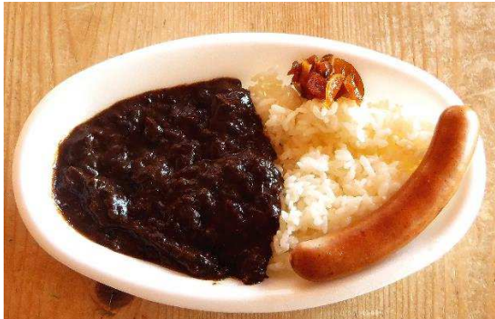
ホビットカレー(ウィンナー付き) 900円 930円