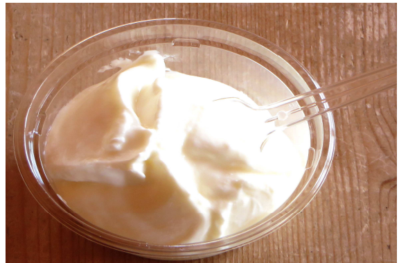
自家製ヨーグルト 330円 350円