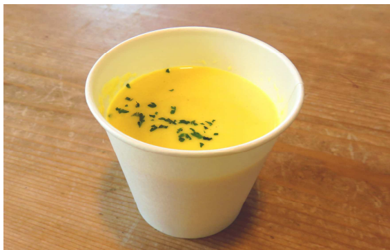
コーンスープ 410円 430円