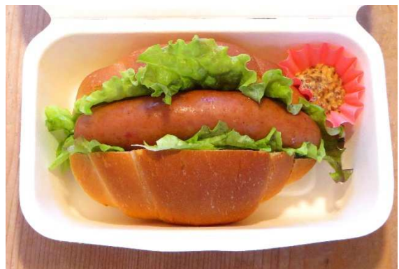
ホビット・ドッグ 410円 420円