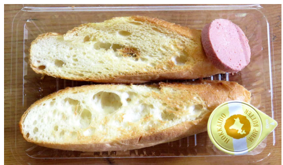
バケット (バターorレバーペースト) 290円 300円