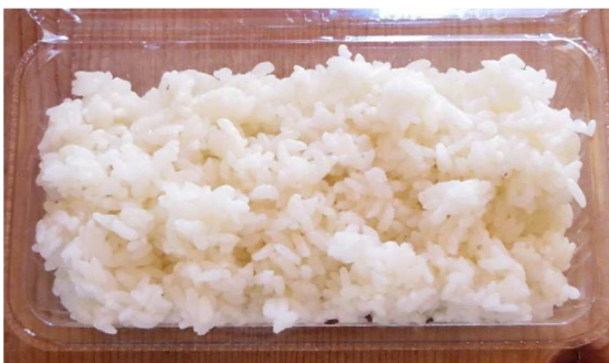
ライス 240円 250円