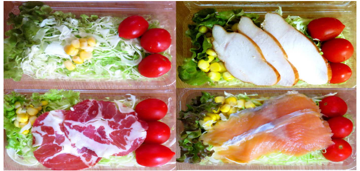
サラダ 290円 300円 チキンサラダ、生ハムサラダ、トラウトサラダ 470円 480円